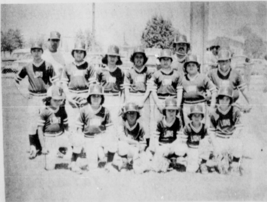
En esta foto los campeones de Northwest Little League Los Lions de Reese Air Force Base. Ellos tambien estuvieron en un torneo esta pasada semana.

Ellos tocan un tipo de musica contemporanea y retadora. La mayoria de la musica es musica de protesta y emocionante. Habra una presentacion de este grupo en la television educacional de la Universidad de Texas Tech Canal 5 en el programa de Viewpoint este domingo dia 10 del presente a las 6 de la tarde y se repite el lunes dia 11 a las 10:30 de la noche.