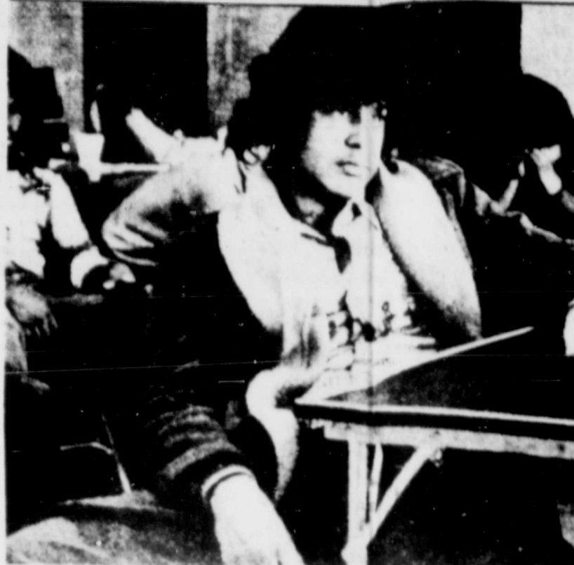
El sistema escolar de Texas está persiguiendo a los niños indocumentados, por cobrarles por los estudios, o negándoles admisión.

Declaró que es una desgracia ver en las calles a niños que deberían asistir a la escuela. "Esto es sólo el principio," dijo, "estamos preparados para una larga y fatigosa batalla legal".