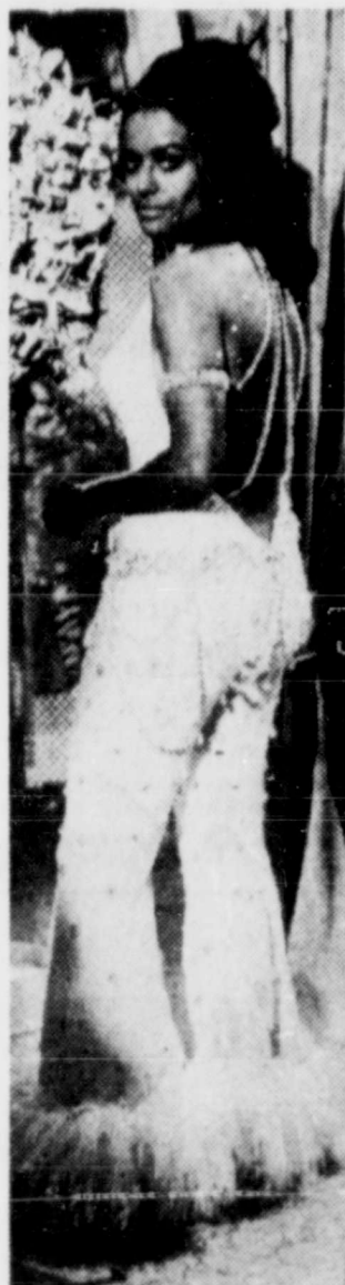
BELLEZA.— La cantante y actriz, Barbara McNair luce estos pantalones de campana en una película en que actúa. Tiene descubierta la espalda y sus pantalones son de nylon elástico adornados con plumas de avestruz. (NEA).

Slide Road beginning at 7:30 PM. Admission will be $1.00 for 10 games. Play will be for cash prizes. Door prizes will be given to advance ticket holders. All proceeds will be used for scholarships to deserving college students.