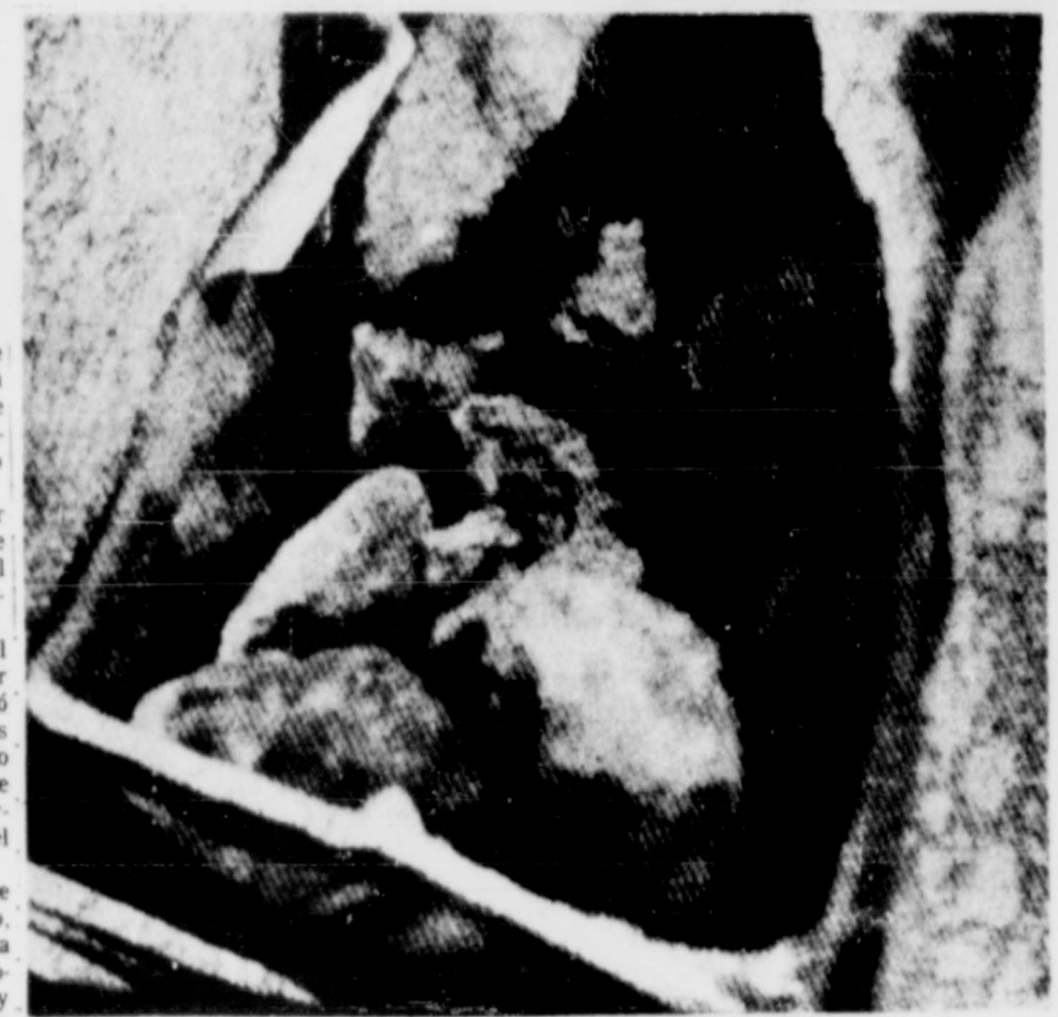
PIEDRAS DE LA LUNA—Estas son las piedras que trajeron a Tierra los astronautas del Apolo 11. Fueron fotografiadas el sábado en el laboratorio de Vuelos Tripulados de Houston

Sin embargo, por ahora, Humphrey mantuvo silencio. En jira europea, fue entrevistado por los periodistas en Dubrovnik, Yugoslavia, donde dijo que la decisión de McCarthy "abre muchas posibilidades". El ex vicepresidente, en la parte final de la jira por Europa Oriental y la Unión Soviética, regresó a Washington el sábado por la noche.