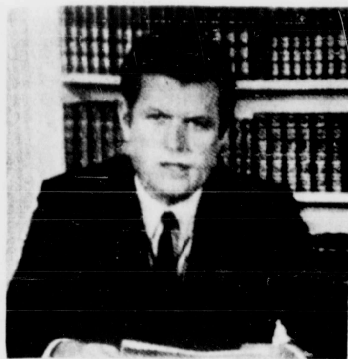
EL SENADOR Edward Kennedy, durante su alocución televisada a la nación, en la que se declaró inocente de rumores maledicentes sobre la muerte de su Secretaria.