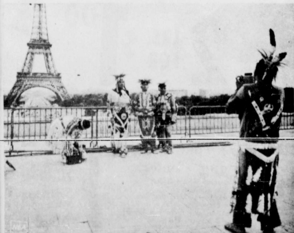
INDIOS EN PARIS.— Al igual que muchos turistas, unos indios norteamericanos aparecen posando para unas fotos teniendo al fondo la Torre