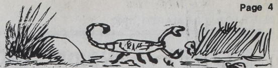
LOS ALACRANES LOS QUE PICAN CON LA COLA

Aquel hombre, ya no estaba! (continúa la semana proxima)