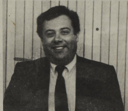
Gorge de la Mora

For more information contact L.E.A.D., Inc. at (806) 744-7426; or visit its offices at 1111 Ave. J.