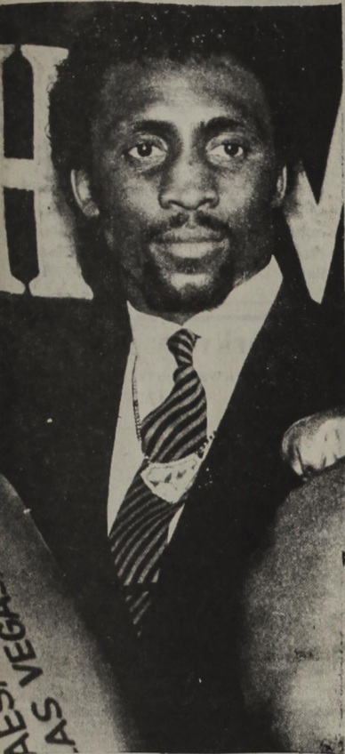
TOMMY HEARNS, BOXEADOR DEL AÑO PARA EL CMB

MEXICO D.F. El Consejo Mundial de Boxeo anuncio aquí, que el próximo día 27, en Los Angeles (EE.UU.) premiará a los boxeadores más destacados en 1984, encabezados por el norteamericano Thomas Hearns, al que designó como "Boxeador del Año".