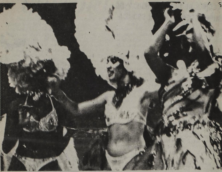
ALEGRIA DEL CARNAVAL

Dicho periodista finalmente apuntó que "los dueños de la tierra de Chihuahua ahora tienen que andar pidiendo limosna para sobrevivir".