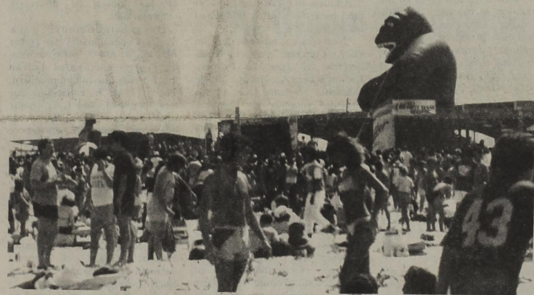
Spring Breakers meet at South Padre Island during Spring break. An all day concert was being sponsored by Miller Brewery on Sunday. South Padre Island seems to attract people from other states as well as Texans to join the beach partying. Another concert will be sponsored by Budweiser on Friday, March 15.