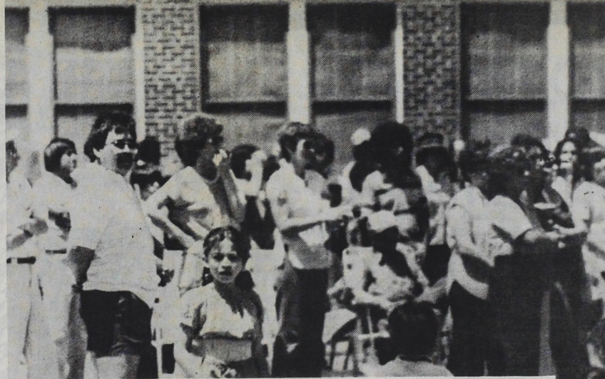
Miembros y estudiantes del Comité para Componer la escuela Thompson se juntaron la semana pasada en un rally que se llevo a cabo en dicha Escuela. Los participantes buscan que se componga la escuela en vez de que se cierre como quiere la Mesa Directiva de las Escuelas. Ellos presentaran peticiones en la proxima junta del 19 de Junio de la Mesa Directiva.

Hasie said today school officials may have a report on the outcome of the Abilene meeting at the school board meeting scheduled for June 19.