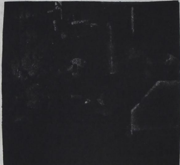
A new program will be initiated in the fall at South Plains College, affiliated with Methodist Hospital. For more information contact: South Plains College 1302 Main - Lubbock, Texas - 747-8111.

Job opportunities are with private Dr.'s office, Hospital, and Military Services. Starting salary is between $785.00 to $950.00 a month depending on working area.