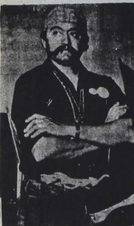
QUE VIVIA LA UNION!

Unidos como del vecino país. Al respecto, Orendain declaró que continuarían organizando a trabajadores de ambos países, sin importar su estado legal, porque lo que afecta a unos afecta igualmente a los otros.