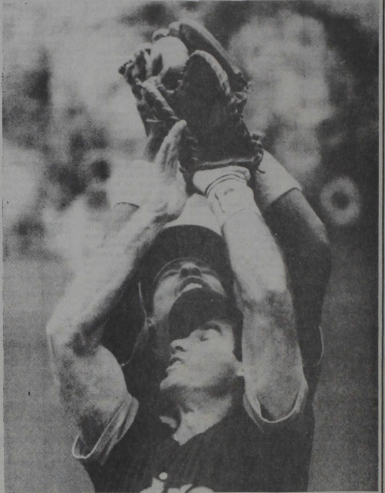
SAN LUIS En la foto los jugadores de Los Padres de San Diego Steve Garvey, al frente, y Alan Wiggins intentan apoderarse de la pelota que bateara Willie McGee de Los Cardenales de San-Luis en el ranscurso de la quinta entrada del partido que se disputó en esta ciudad.