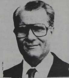
Por: Dr. Angel C. Erquiaga

La fractura de los dientes anteriores es un problema muy frecuente entre los jovencitos, siempre como resultado de accidentes deportivos; fútbol, baloncesto, beisbol, etc., y el más peligroso es en las piscinas empujándose unos a los otros al agua y al dar con la boca en el borde de ésta como consecuencia se da la fractura de los dientes anteriores, especialmente los centrales superiores. Si estos dientes fracturados no son tratados, pueden producirse grandes abcesos con posible pérdida de esos dientes; pueden producirse problemas psicológicos; o el mal hábito de introducir la lengua entre los dientes fracturados.