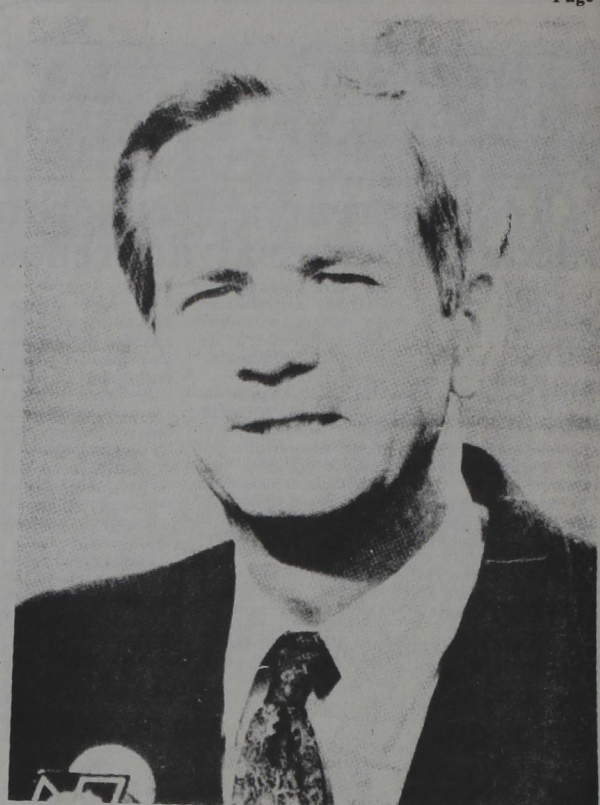
ROBERT MCFARLANE, Consejero de Seguridad Nacional del presidente Reagan se negó a comentar el apoyo financiero encubierto de la CIA a Duarte, porque la Administración —dijo— no comenta las actividades de

Un portavoz de la Embajada norteamericana en El Salvador confirmó que Estados Unidos había financiado parcialmente los gastos de las visitas de grupos de periodistas europeos y latinoamericanos a El Salvador y otros países centroamericanos en los últimos ocho meses. Estados Unidos —dijo— pagó los billetes de avión, mientras los periodistas pagaron sus gastos de hotel y demás. Reconoció que era muy poco frecuente que el gobierno norteamericano corriera con los gastos de viaje de reporteros.