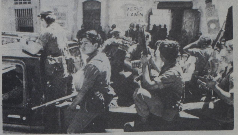
SAN LORENZO, EL SALVADOR Más de 40 jóvenes alumnos de la Guardia Nacional Salvadoreña, montaron un modesto centro de operaciones en este poblado, donde se han venido dando fuertes combates con las tropas rebeldes. En la foto varios jóvenes soldados patrullan las calles del pueblo.

SAN SALVADOR.- Violentos combates se desarrollaron en la población de San Lorenzo, 58 kilómetros al Este de San Salvador, en el Departamento de San Vicente, informaron fuentes castrenses.