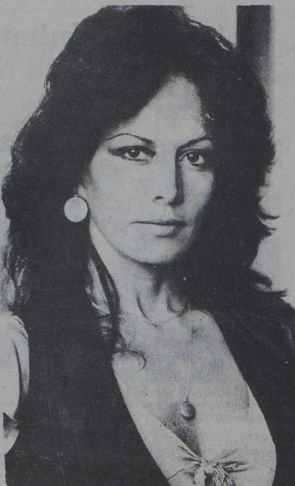
¿Sabían ustedes que la actriz Isela Vega se encuentra de vacaciones en el Puerto de Acapulco? Isela en días pasados causó sensación en una playa por ponerse un traje de baño demasiado atrevido. Sus admiradores la reconocieron inmediatamente y armaron gran revuelo.

La gente de aquel lugar tenía la costumbre de sacrificar a sus dioses o ídolos seres humanos, hombres o mujeres. Entonces, Dios puso a prueba otra vez el amor de Abraham. Quiso ver si el amor de Abraham era tan fiel hacia su Dios por lo menos igual al amor que tenían los cananeos para con sus dioses o ídolos.