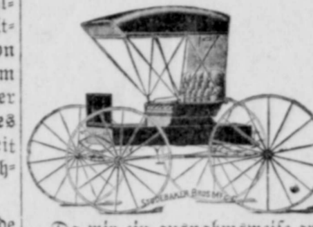
Studebaker und Mitchell Wagen.