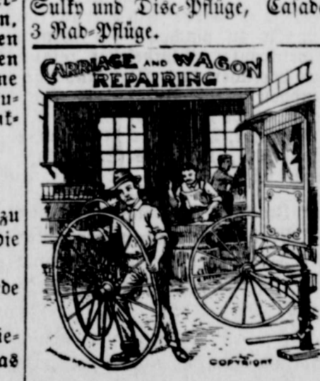
CARRIAGE AND WAGON REPAIRING

Alle Reparatur an Buggies und Wagen, sowie Pferdebeschlagen, wird gut und billig ausgeführt.