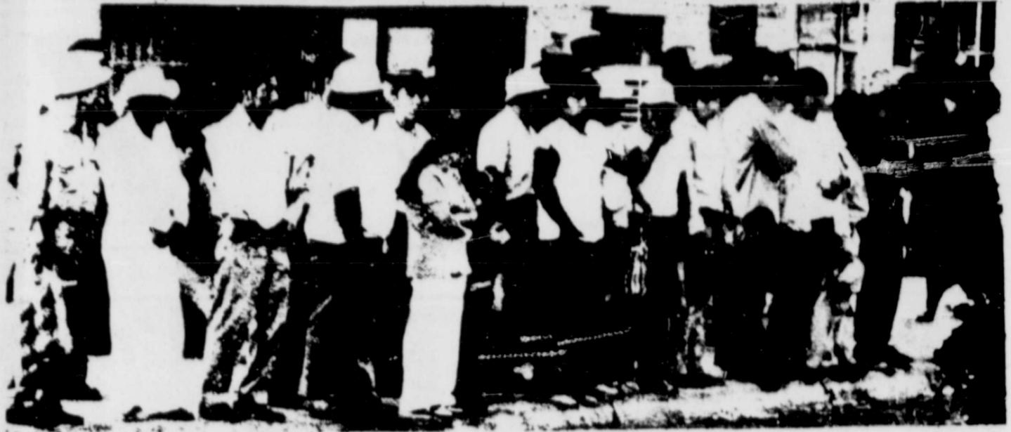
Campesinos esperan a sus troqueros. El campesino nunca a tenido con que defenderse de estos rateros, quien muchas veces se embolsan el seguro social del trabajador.

El campesino tienen que viajar a traves el pais para ganar la vida y no teniendo buena transportation tiene que vivir cerca a su trabajo. Es una practica comun, debido a la cantidad de migrantes, que el rancho y las emparadoras ofrecen viviendas de renta al campesino durante la cosecha. De sus