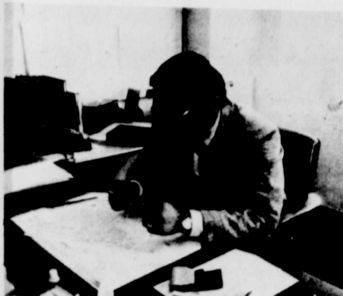
QUIEN ES QUIEN EN COMA

For more information on El Calendario Chicano 1976 write to Southwest Network, 1020 B Street Suite 8, Hayward California 94541.