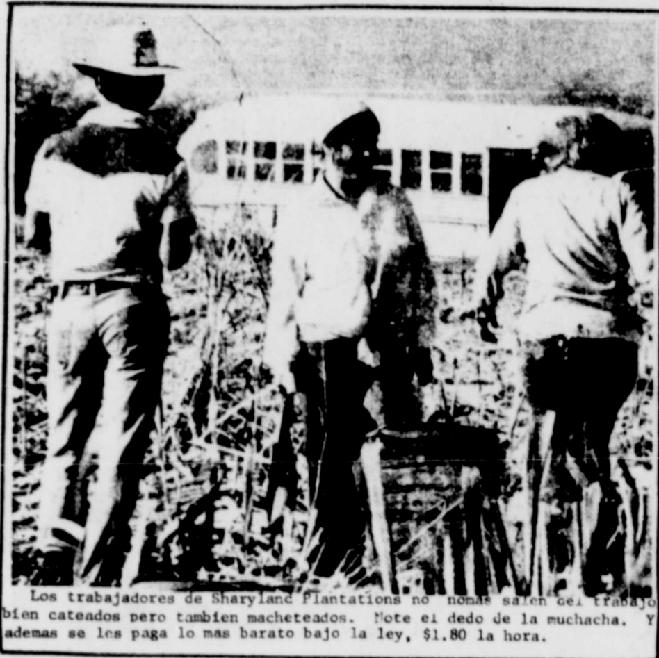
Los trabajadores de Sherryland Plantations no nomas sacan los trabajos bien catenados pero tambien macheteados. Note el dedo de la muchacha. Y ademas se les paga lo mas barato bajo la ley, $1.80 la hora.