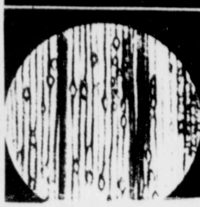
Parte superior izquierda: Violeta y sección transversal ampliada de su tallo. Parte superior derecha: Lirio amarillo y sección ampliada de una hoja.