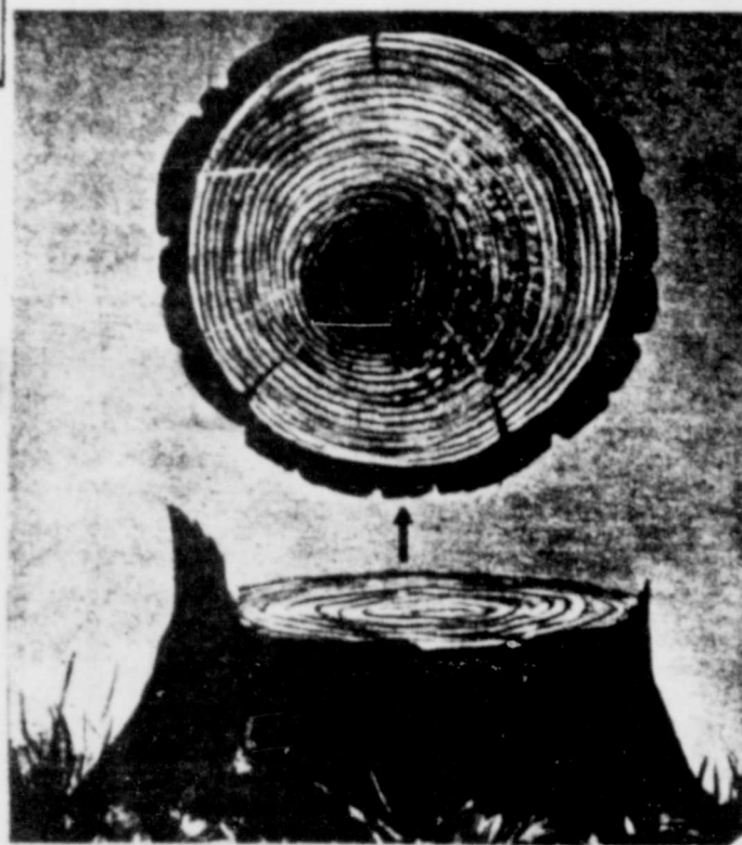
Cuando se corta un árbol, mediante la cuenta de sus anillos se conoce la edad.

BATERIAS LUBRICANTES - LAVADO Y ENGRASADO - FLATS - COMPLETA REPARACION DE MOTORES Y TODO LO QUE CONCIERNE A MECANICA VISITENOS - LO ESPERAMOS