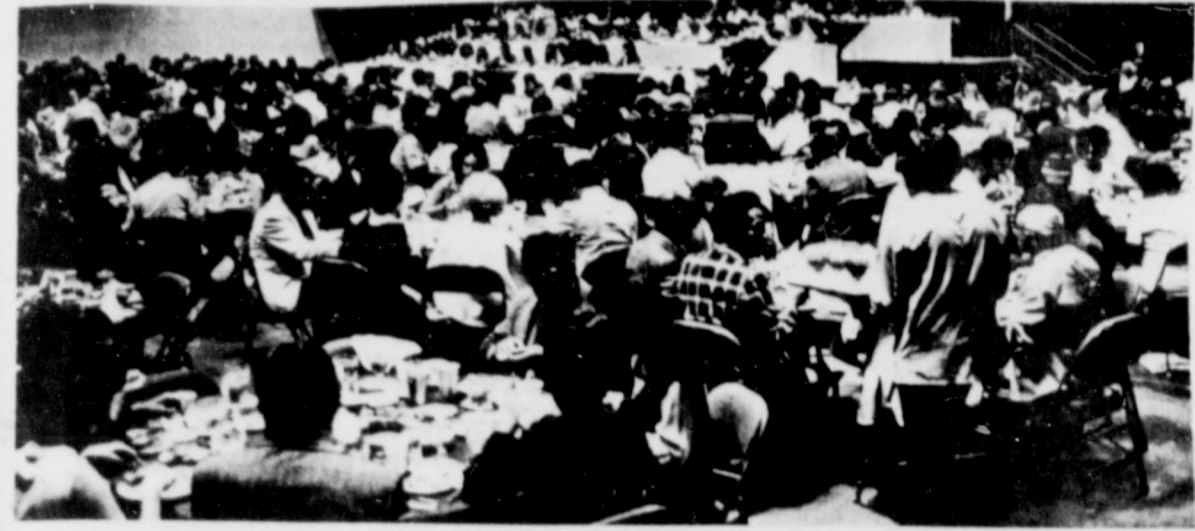
BANQUET CROWD - Part of the huge crowd which attended the 1973 National Convention Banquet held in Paso's beautiful Civic Center. Hundreds of GI Forum delegates and friends were addressed by Dr. Hector Garcia, GI Forum Founder; and New Mexico Senator Joseph Montoya.

And I am hopeful the bill will gain quick approval in the House of Representatives.