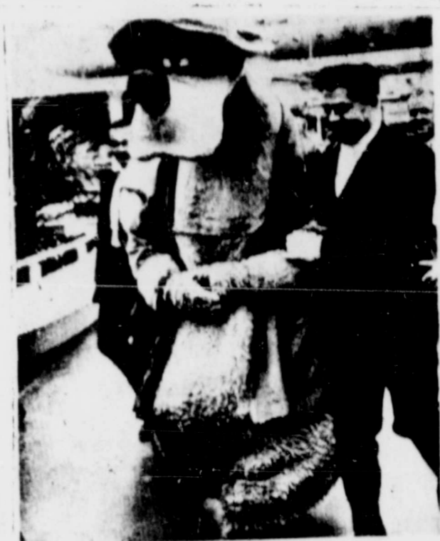
ANAHEIM, California, Octubre 24 (AP).- El general Gery Berengovoy, uno de los dos cosmonautas sovieticos en una jira por los Estados Unidos, toma del brazo al hermano oso

Agrego Jacobo que los "Ciudadanos pro Justicia Social estamos con ustedes," y que su grupo los respaldaria hasta el fin. Dijo que "nuestra causa es una noble causa," y que sera ganada por medios nobles. La Srta Jacobo tambien dijo buenas palabras de la policia.