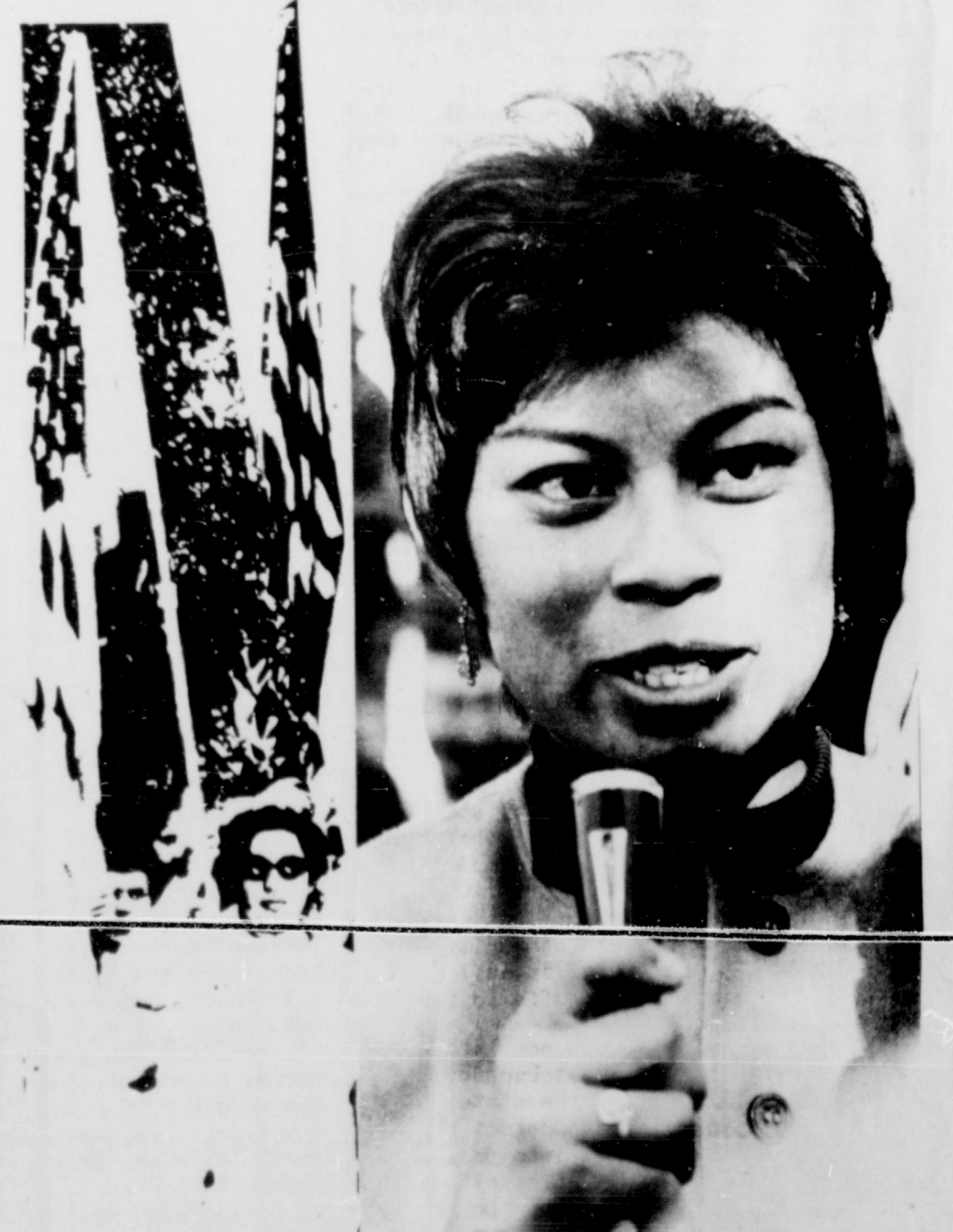
PAULINA JACOBO STATE PRESIDENT OF CITIZENS FOR SOCIAL JUSTICE