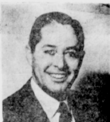
SENATOR JOSEPH M. MONTOYA NATIONAL CO-CHAIRMAN OF "VIVA HUMPHREY"

Las necesidades de los E.U. son comprendidas por Hubert Humphrey y Edmund Muskie. — Robert Kennedy