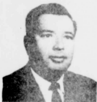
Raul Muniz State Representative