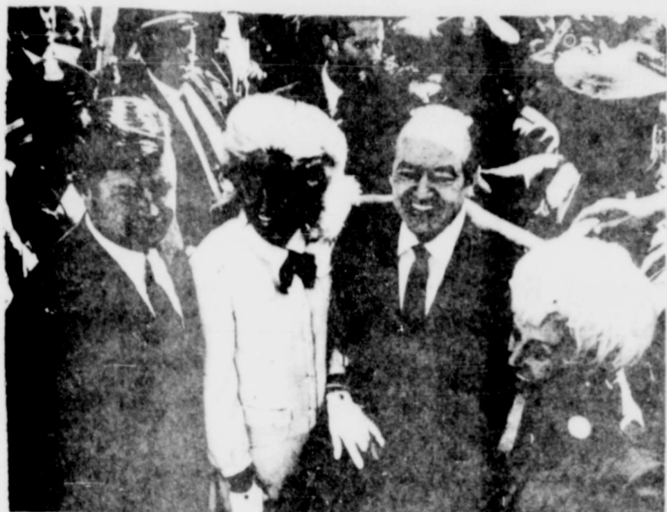
SENATOR EDWARD KENNEDY ENDORSES HUMPHREY

"America's Spanish-speaking Americans from California and the Southwest to Florida and New York will put their votes where their hearts are . . . with the Vice President of the United States, who has championed them with a warm heart, a compassionate hand and a fertile brain. He has worked for their betterment over the years as a Senator and Vice President. They know that as President of the nation, he will do more for them than any other candidate."