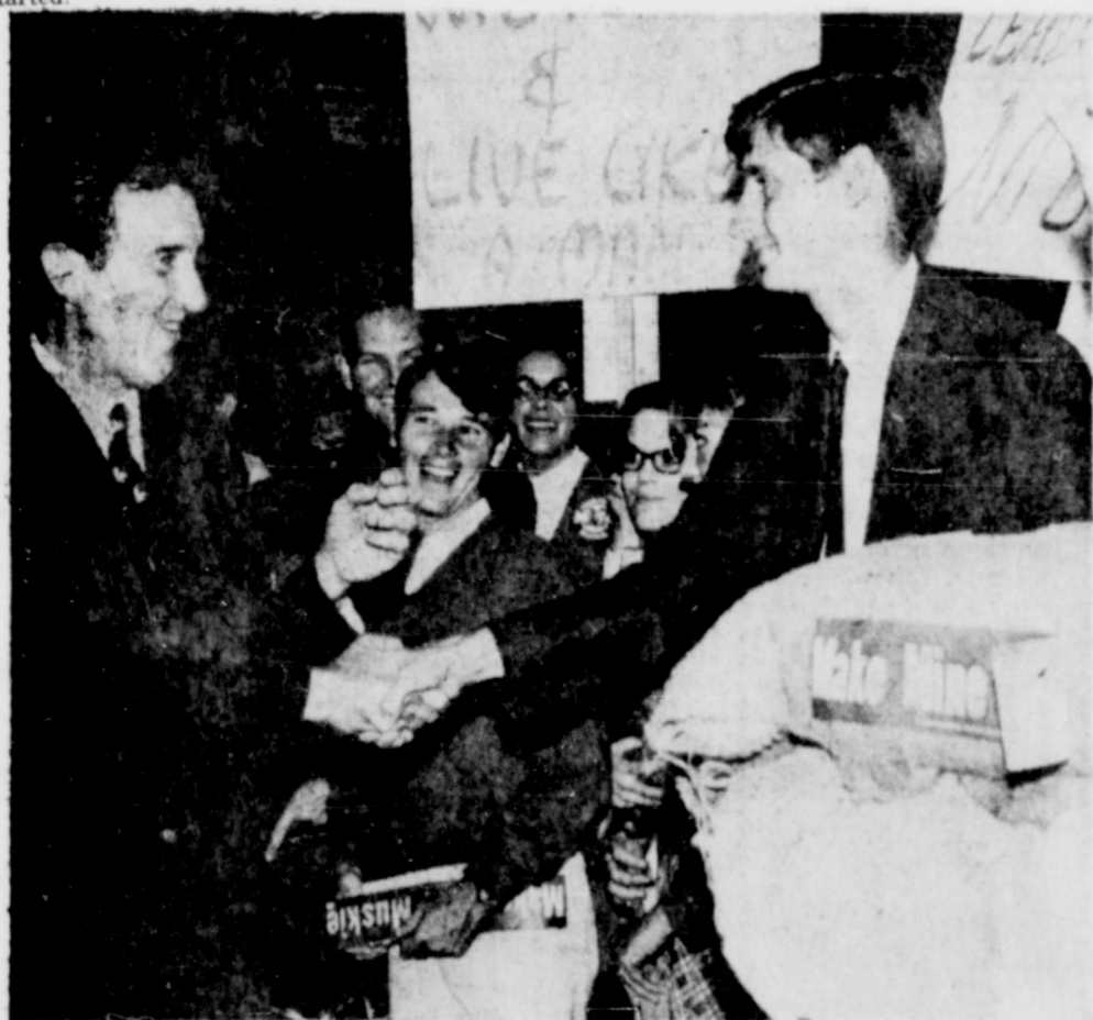
"HELLO, MR. SENATOR"—Students of Texas Tech and area high schools were on hand to greet Democratic vice presidential nominee Sen. Edmund Muskie

Robert Kennedy came to Delano before his assassination and drew a crowd of 12,000 at the "40 acres"—a plot outside Delano.