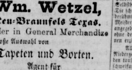
Logo for Wm. Wetzel featuring a star and the text 'Wm. Wetzel'.