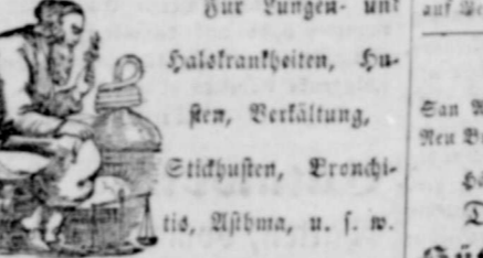
Portrait of a man, likely a doctor or a scholar mentioned in the text.